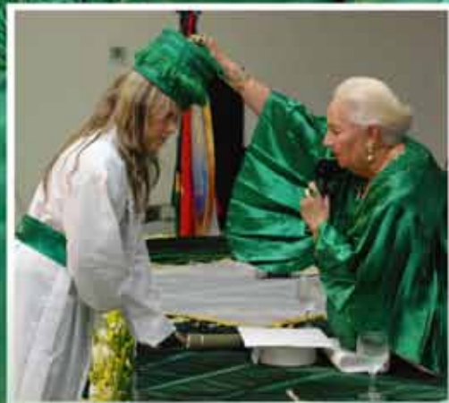
Recebimento do Grau, momento mais importante da cerimônia.